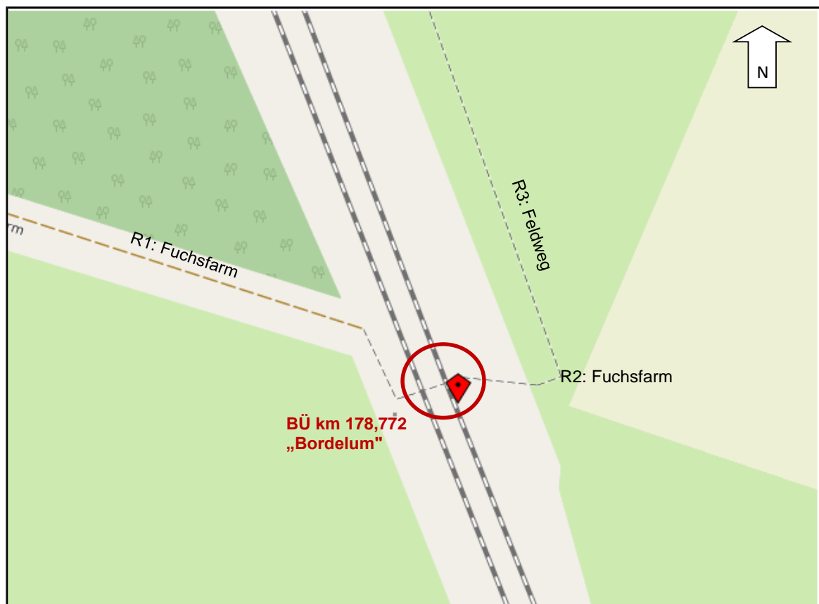
Abbildung 2: Übersicht Einmündungen am BÜ „Bordelum“ (Auszug OpenStreetMap 2024)