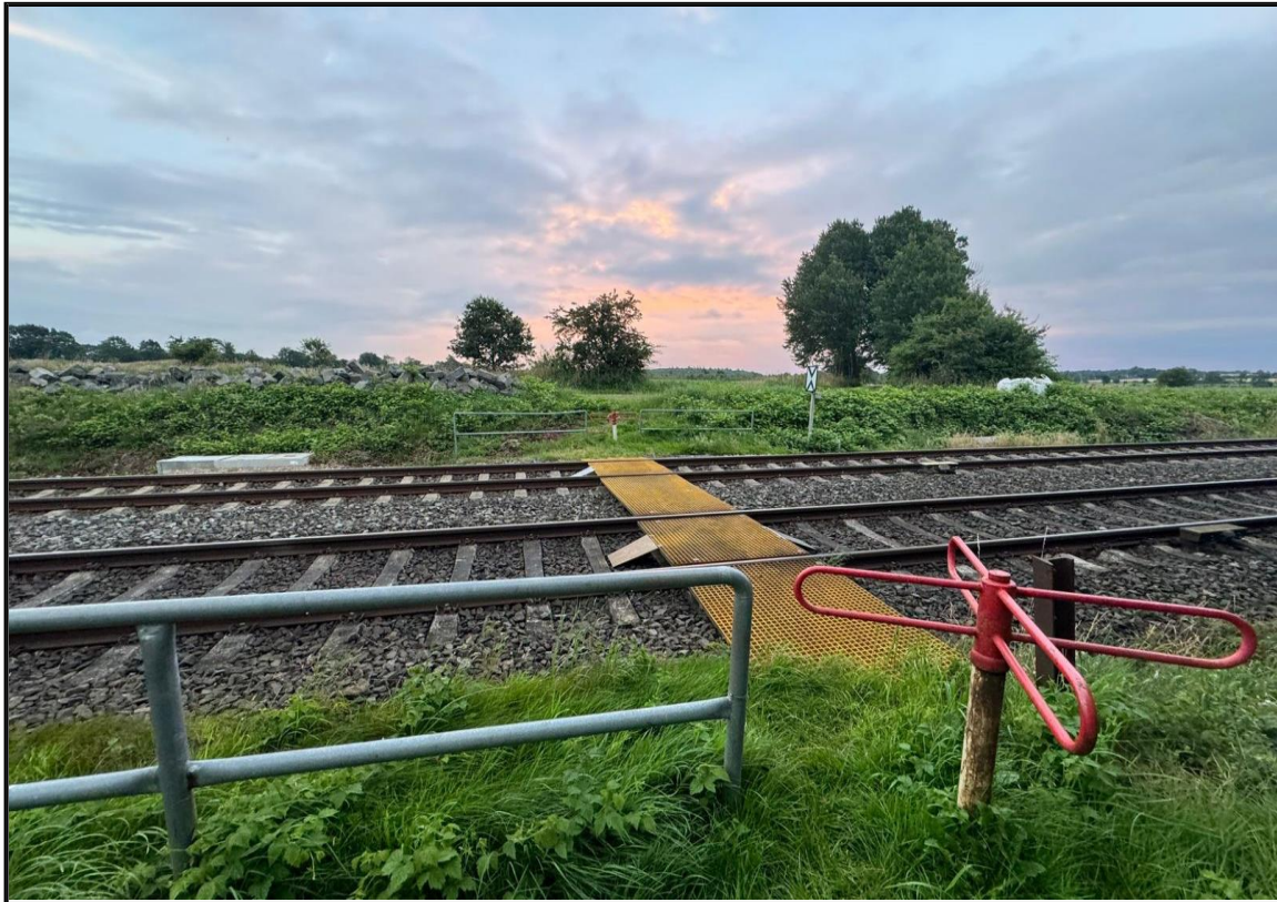
Abbildung 1: BÜ km 178,772 „Bordelum“, Strecke 1210, Gemeinde Bordelum Blick in Richtung Osten

Es wurde eine Verkehrszählung am Bahnübergang km 178,772 „Bordelum“ in der Gemeinde Bordelum, auf der Strecke 1210 (Elmshorn - Westerland) durchgeführt.